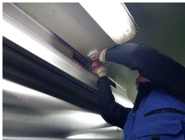
◀ 써모센서 및 NTR 설치모습

해썹온도관리솔루션 NTR은 디지털써모센서, 도어센서, NTR 데이터로거, 통신모듈, 클라우드 모니터링시스템 등으로 구성되며, 디지털 방식을 채택하여 높은 신뢰성을 보장합니다.