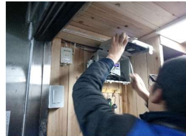
데이터로거 및 통신모듈 ▶